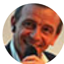
TABLE RONDE ANIMÉE PAR :

Amélie de MONTCHALIN Ministre de la Transformation et de la Fonction Publique